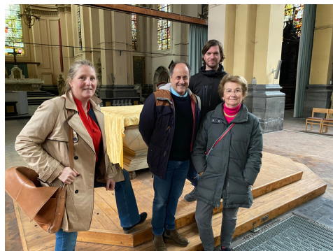
L'équipe de la Toile de Malel avec Malel

Nous aurons également la joie d'exposer une toile du peintre Malel (cf page suivante)