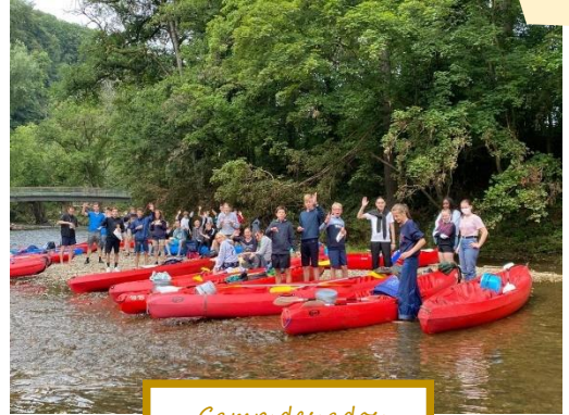
Camp des ados