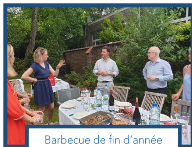
Barbecue de fin d'année des catéchistes