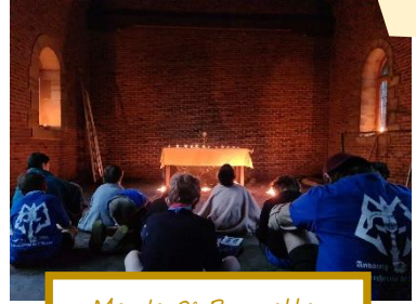
Meute 9 e Bruxelles