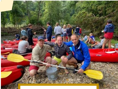
Camp des ados