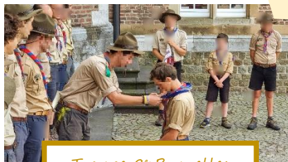
Troupe 9 e Bruxelles