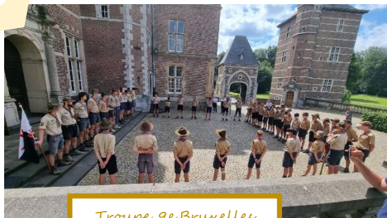
Troupe 9 e Bruxelles