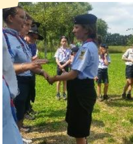
Clairière 10 e Bruxelles