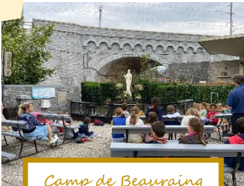
Camp de Beauraing