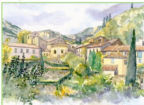
Eglise abbatiale Saint Guilhem-le-Désert