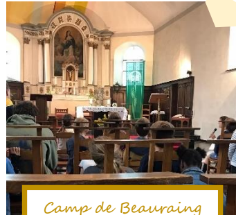
Camp de Beauraing