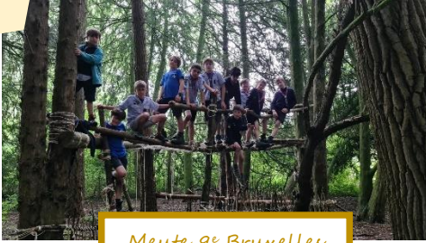
Meute 9 e Bruxelles