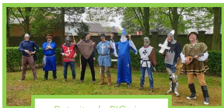
Retraite de PIC : jeu organisé par les papas

Les PIC c'est une AVENTURE, une aventure merveilleuse et marquante pour la vie entière, une chance inouïe qui conduit à s'engager dans les sacrements de Confirmation et d'Eucharistie.